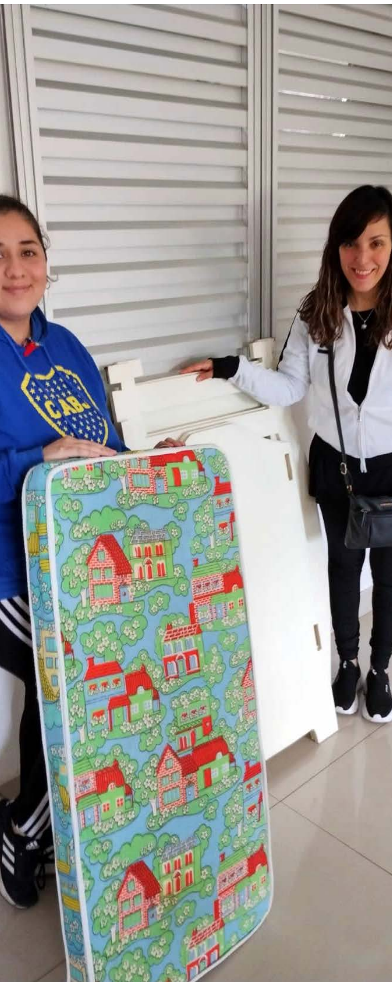
Entrega de cunas y colchones