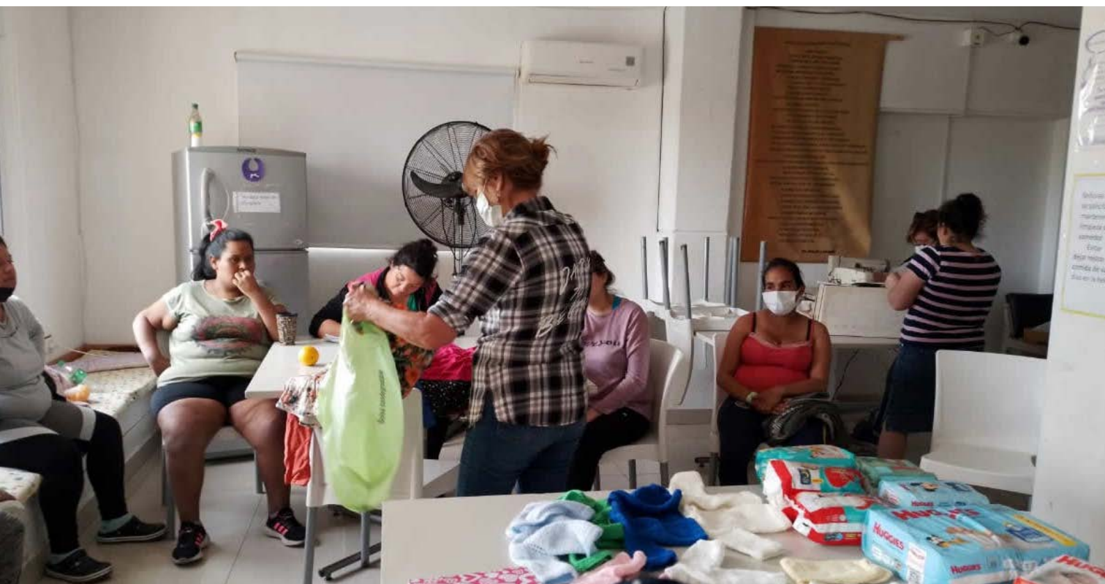
Reuniones mensuales en el Consultorio de Seguimiento

La Red decidió realizar la puesta programática en el hospital antes citado, porque éste cuenta con la maternidad de mayor complejidad de la provincia y, con la regionalización perinatal vigente, resuelve la asistencia de alrededor del 70% del total de los nacimientos prematuros < 32 semanas de la provincia.